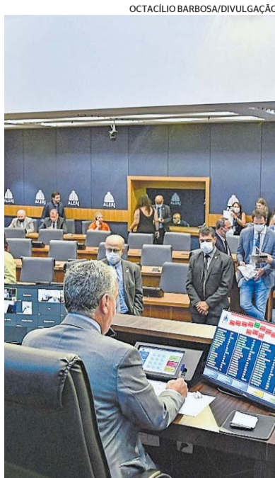
A votação de ontem na Alerj